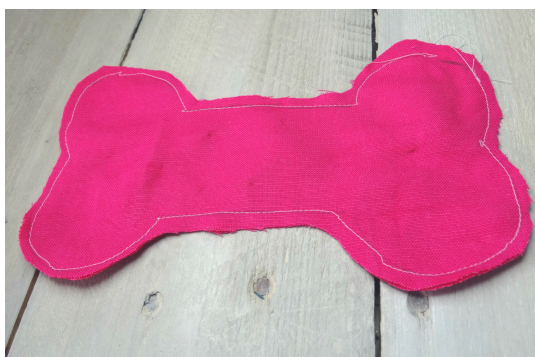
Po usunięciu nadmiaru materiału musimy wywinąć kostkę