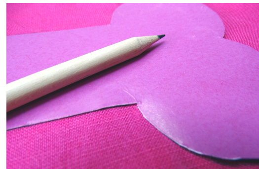
Rysujemy kształt szablonu na tkaninie