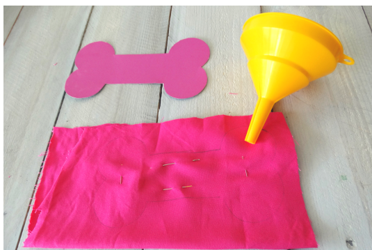
Składamy materiał, przypinamy szpilkami