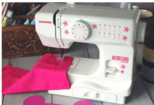
Zszywamy zostawiając otwór na wsunięcie lejka