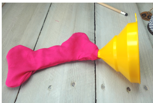
W otwór wsuwamy lejek i wsypujemy lawendę